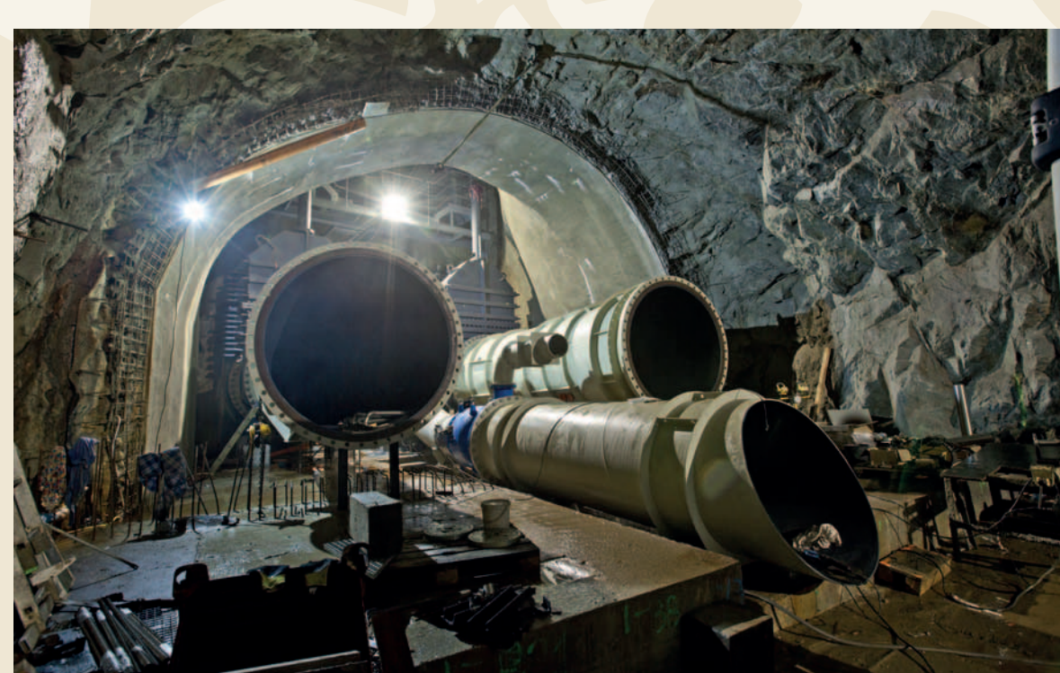
Vodní dílo Labská