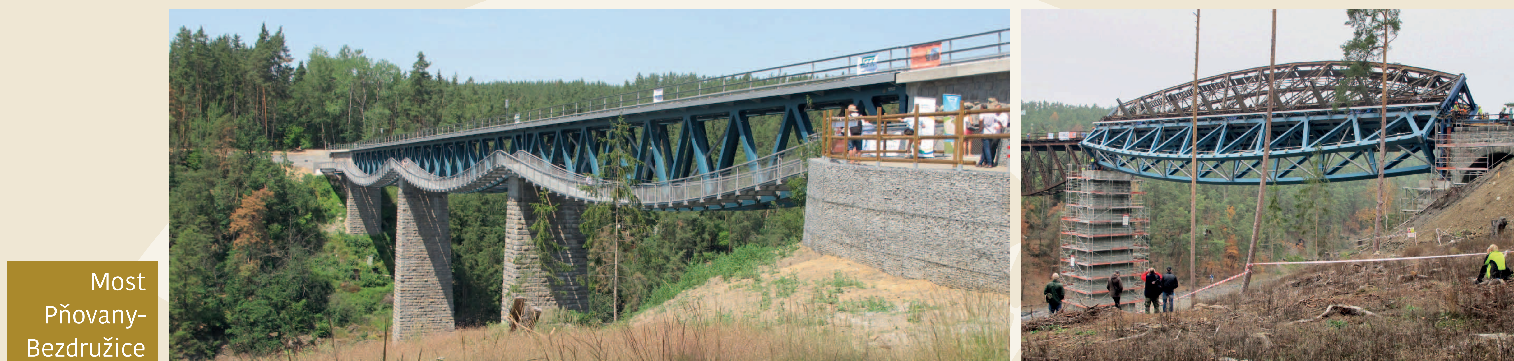
Most Pňovany- Bezdružice