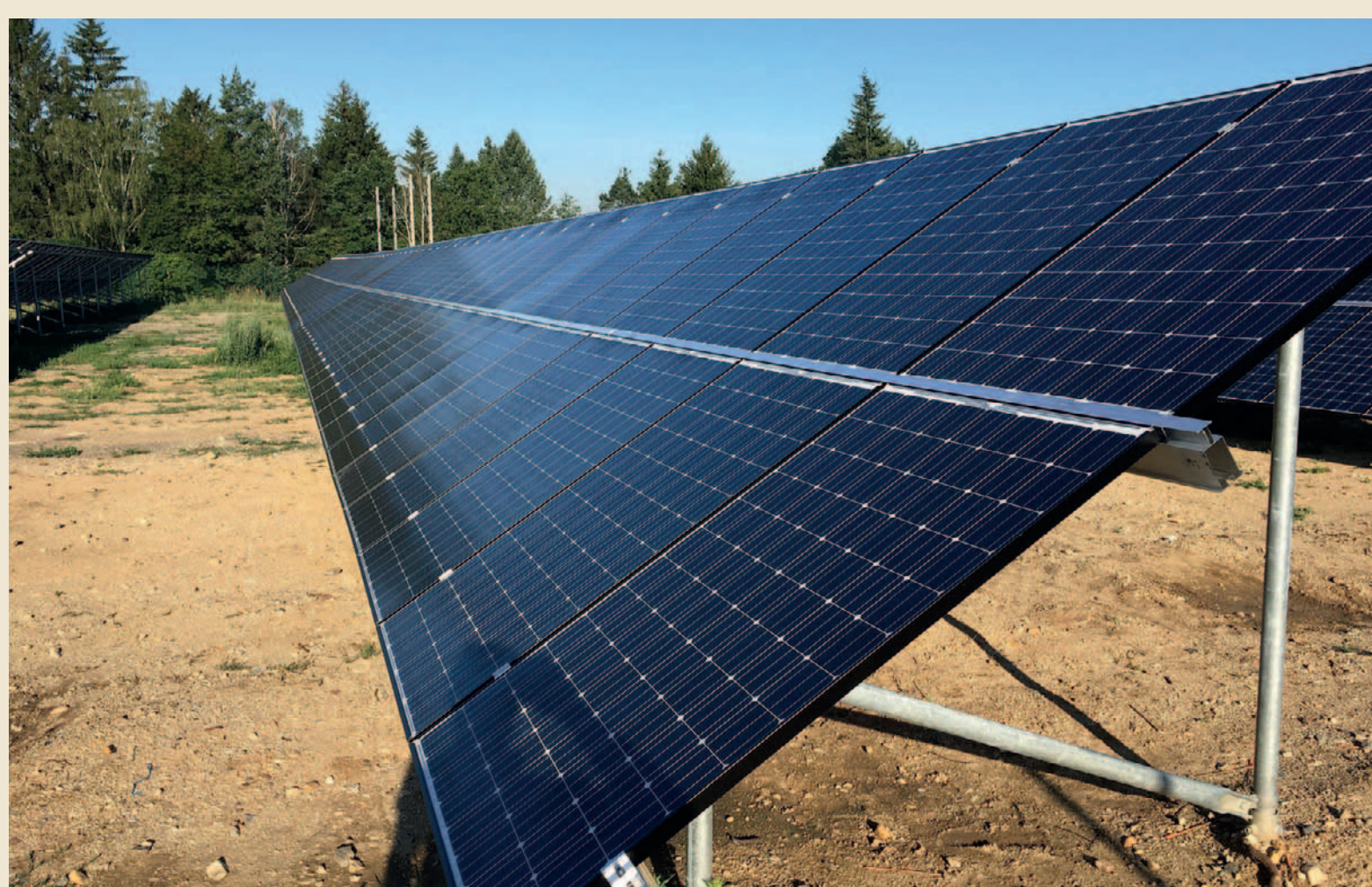
Cena poroty Fotovoltaická elektrárna Teplárny Planá nad Lužnicí