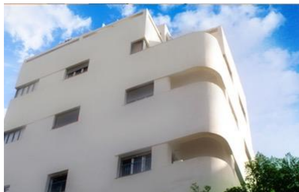
Bauhaus Tel Aviv