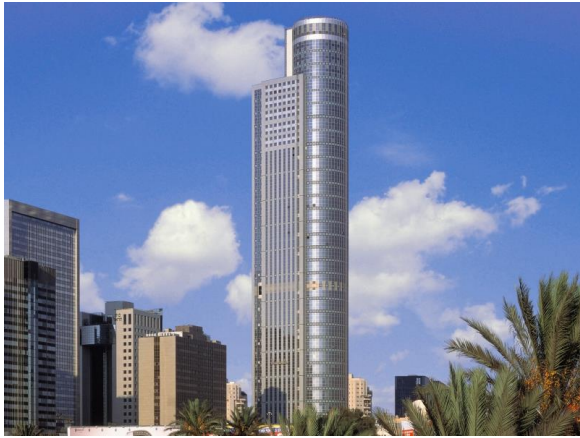
Moše Aviv Tower