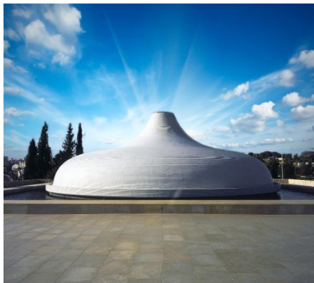
Izraelské muzeum v Jeruzalémě

Snídaně, Izraelské muzeum v Jeruzalémě - návštěva nejvýznamnějšího izraelského muzea, které uchovává vzácné rukopisy od Mrtvého moře - Svatyně knihy (pozoruhodná stavba moderní architektury odkazující k symbolice kumránské skupiny) - v dalším programu pokračování prohlídky zaměřené na moderní architekturu - budova Knesetu – izraelského parlamentu (zvenčí) – obří bronzová menora před budovou Knesetu – symbol judaismu, zvenčí též budovy izraelských ministerstev a budovy Nejvyššího soudu, odpoledne návštěva památníku obětí holocaustu Jad Va-Šem, návrat na hotel do Betléma, slavnostní večere s ochutnávkou vína Cremisan z místních vinic, nocleh.