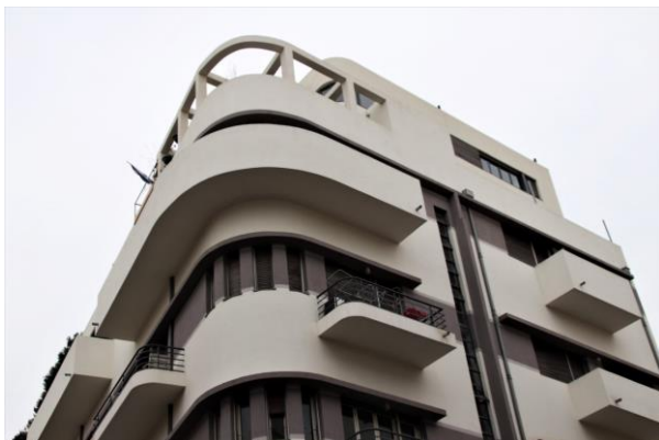
Bauhaus Tel Aviv

Snídaně - Jafské přístaviště - starobylé přístavní město zmíněné ve Starém i v Novém zákoně, např. v souvislosti s králem Šalomounem, který si sem loděmi nechával dovážet cedrové dřevo z oblasti dnešního Libanonu na stavbu chrámu v Jeruzalémě, odpoledne procházka po Tel Avivu se zaměřením na unikátní soubor zdejších funkcionalistických staveb, které vznikly pod vlivem umělecké školy Bauhaus, první izraelská výšková stavba Migdal Šalom Meir ze šedesátých let minulého století, návrat na hotel do Betléma, večere, nocleh.