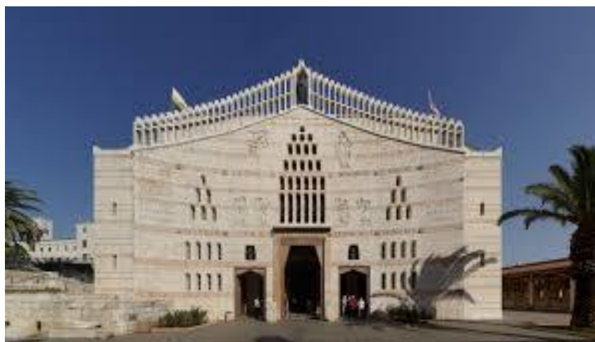
Bazilika Zvěstování - Nazaret

Snídaně, Nazaret - prohlídka nejvýznamnějších památek města - bazilika Zvěstování (vzácná památka moderní sakrální architektury), Kána Galilejská - místo prvního Ježíšova zázraku proměny vody ve víno, odpoledne významná starověká pevnost Megido s unikátním řešením přístupu k vodnímu zdroji, návrat na hotel do Tiberiady, večere, nocleh.