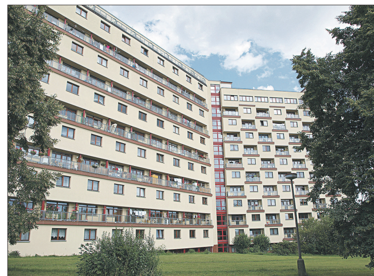
Litvínovský Koldom se stal ztělesněním myšlenky kolektivního bydlení.

bení pitnou vodou demograficky rostoucí oblasti. Myšlenka využití Flájského potoka jako vodního zdroje pocházela již z počátku 20. století. První návrh vznikl v době rozvoje chemického průmyslu v Žaluzi za druhé světové války, k realizaci však došlo až v 50. letech, na nově nalezeném místě nad obcí Fláje. Výhodnější poloha se stabilním skalnatým podložím umožnila realizaci u nás ojedinělé piliřové varianty hráze, která navíc přinesla úsporu betonu o 30 procent oproti hrázi plné. Stavba byla zahájena roku 1951 razbou tlakové štoly do úpravny v Meziboří, vzdálené více než 7 km.“