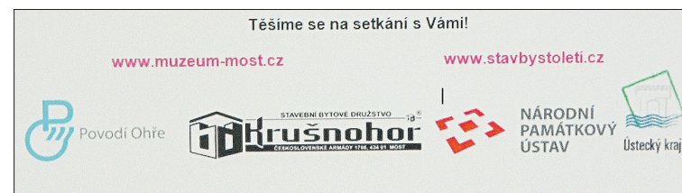
Logo akce a loga partnerů nominovaných staveb (Fláje – Koldom – Kostel – Nominující instituce). Nezapomeňte hlasovat! Adresa je vlevo v barevném rastru.