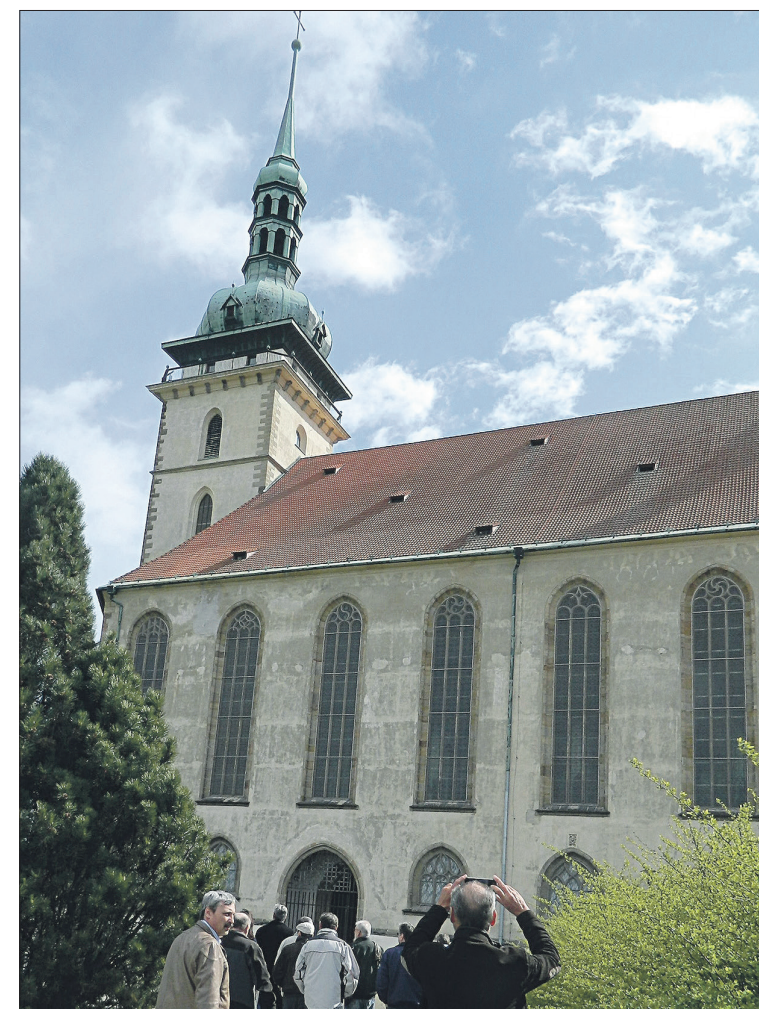
Přesun kostela Nanebevzetí Panny Marie je triumfem stavebního inženýrství.

lových podniků, který tak budoval specifický druh sociálního zabezpečení a servisu pro své zaměstnance,“ píše web Stavby století.