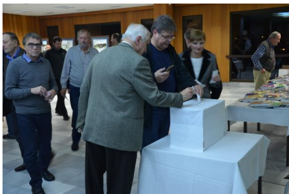
další foto viz

http://cssi.rajce.idnes.cz/Valna_hromada_CKAIT_3_1_2018