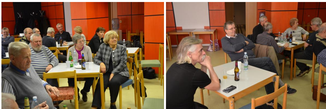
Další foto viz http://cssi.rajce.idnes.cz/VCS 12. 2. 2018