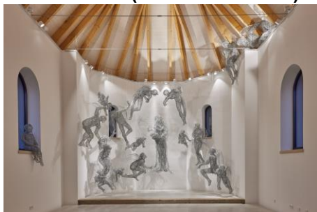
REKONSTRUKCE KAPLE SV. JOSEFA SLAVĚTÍN (OKR. TRUTNOV)