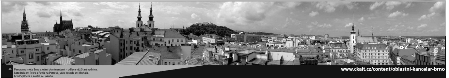
Panorama města Brna s jejími dominantami – odleva věž Staré radnice, katedrála sv. Petra a Pavla na Petrově, věže kostela sv. Michala, hrad Špilberk a kostel sv. Jakuba

www.ckait.cz/content/oblastni-kancelar-brno