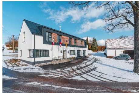
MODERNIZACE BUDOVY OBECNÍHO ÚŘADU V DOBŘANECH