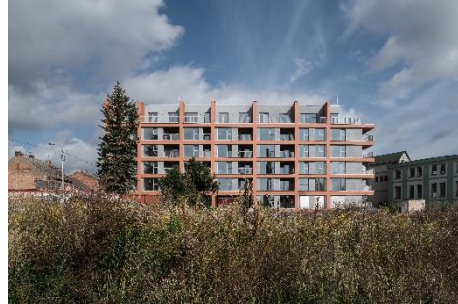
CIHLOVKA 2, KUKLENY