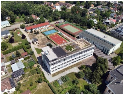
MODERNIZACE A NÁSTAVBA SE ZELENOU STŘECHOU ZŠ ÚPRKOVA HRADEC KRÁLOVÉ