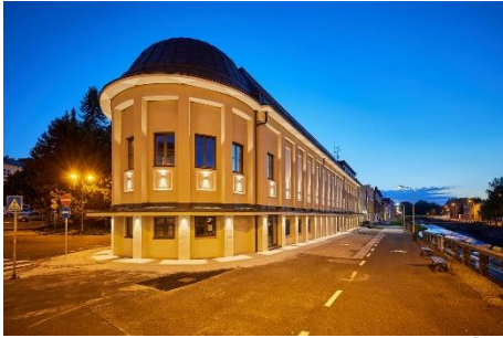
REKONSTRUKCE KINA VESMÍR V TRUTNOVĚ