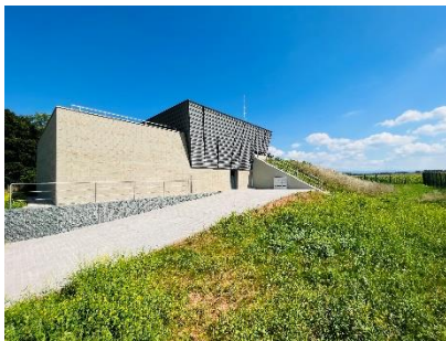
VODÁRENSKÁ SOUSTAVA VÝCHODNÍ ČECHY ZVÝŠENÍ AKUMULACE NA VDJ BOHUSLAVICE