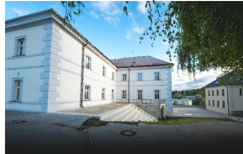
STAVEBNÍ ÚPRAVY A PŘÍSTAVBA OBJEKTU V UL. OPOLSKÉHO č.p. 144 NOVÁ PAKA