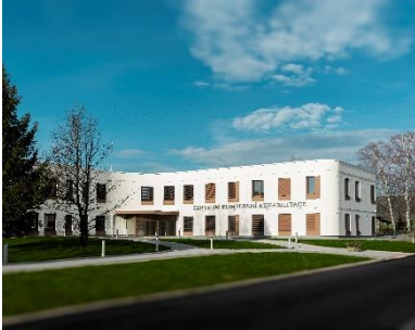
CENTRUM KOMPLEXNÍ REHABILITACE, LÁZNĚ BĚLOHRAD