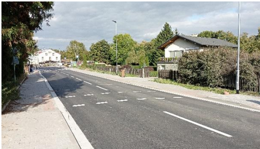
INFRASTRUKTURA ZLÍČ – I. a II. ETAPA