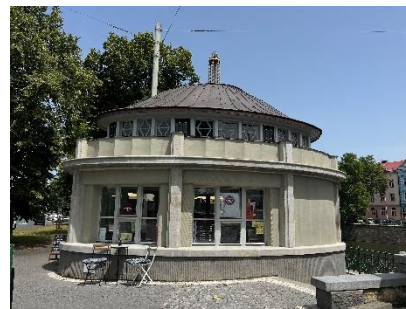
KIOSKY U PRAŽSKÉHO MOSTU