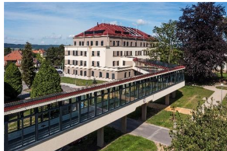
OBLASTNÍ NEMOCNICE JIČÍN NOVOSTAVBA PAVILONU „A“ PRO LABORATOŘE A ONKOLOGII