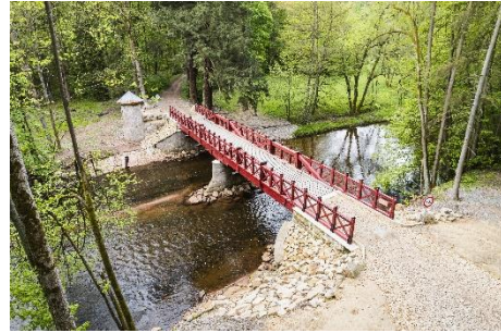
REKONSTRUKCE MOSTU ČERVENÝ MOST, ŽERNOV