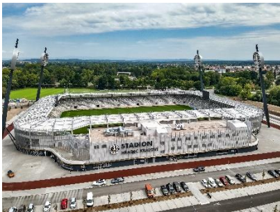
MULTIFUNKČNÍ FOTBALOVÝ STADION HRADEC KRÁLOVÉ