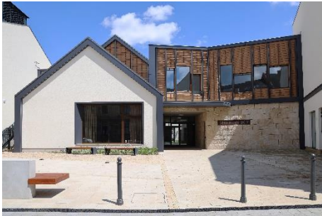
SPOLKOVÝ DŮM NÁCHOD