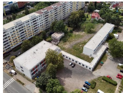
ZUŠ STŘEZINA REKONSTRUKCE – 1. ETAPA

Podrobnosti viz Přihlášené stavby Stavba roku 2024.pdf (ckait.cz)