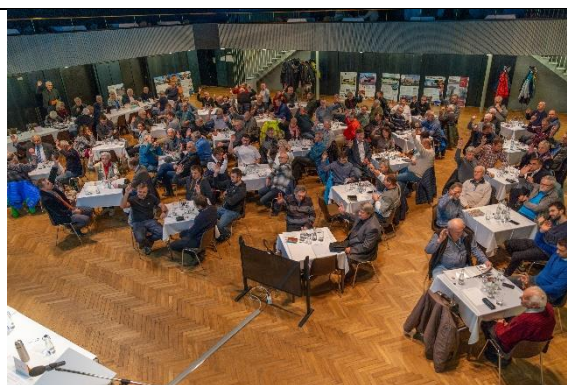
Pohled do sálu