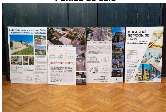
Přihlášené stavby do 21. ročníku veřejné neanonymní soutěže Stavba roku Královéhradeckého kraje 2024.