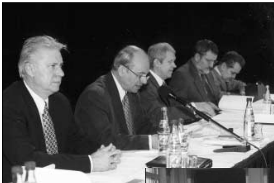
Letošní shromáždění delegátů ČKAIT se konalo v Majakovského sále v Praze na Vinohradech dne 31.3.2001