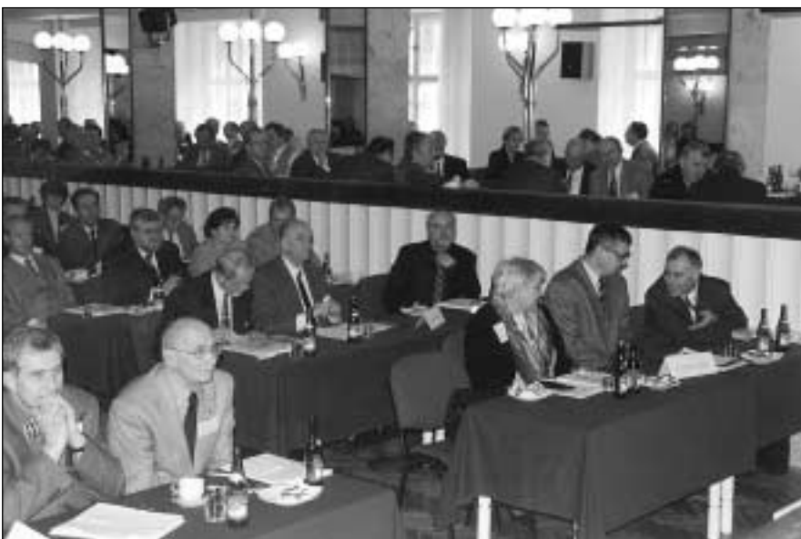
Pohled do sálu

Schváleno v 15,25 hodin všemi přítomnými delegáty (143 pro – 1 zdržel – 0 proti)