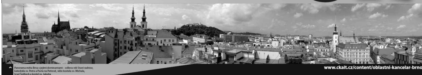
Panorama města Brna s jejími dominantami – odleva věž Staré radnice, katedrála sv. Petra a Pavla na Petrově, věže kostela sv. Michala, hrad Spilberk a kostel sv. Jakuba

www.ckait.cz/content/oblastni-kancelar-brno